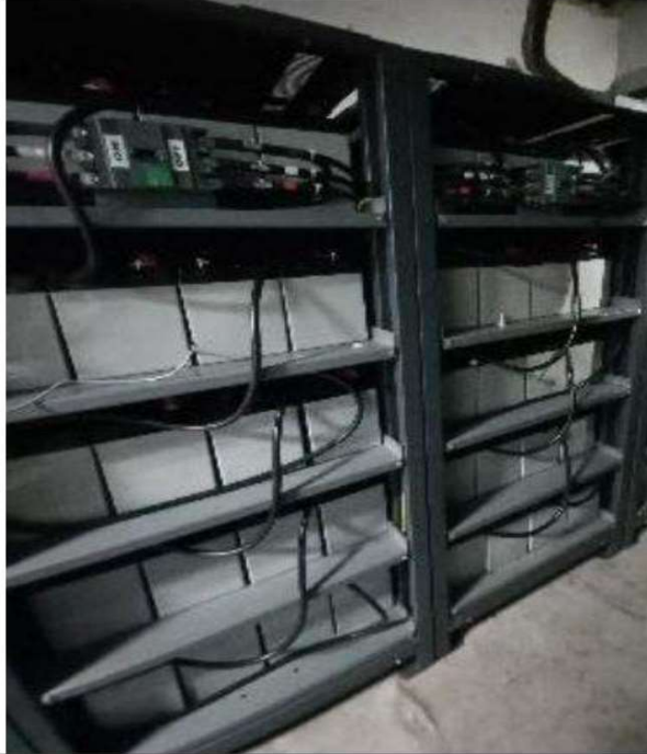
Imagen referencial de las dimensiones actuales de las baterías: