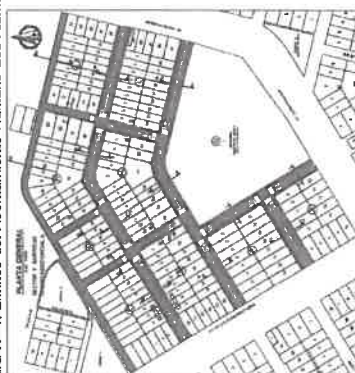
Figura N° 1: Límites del Asentamiento Humano Los Alamos.