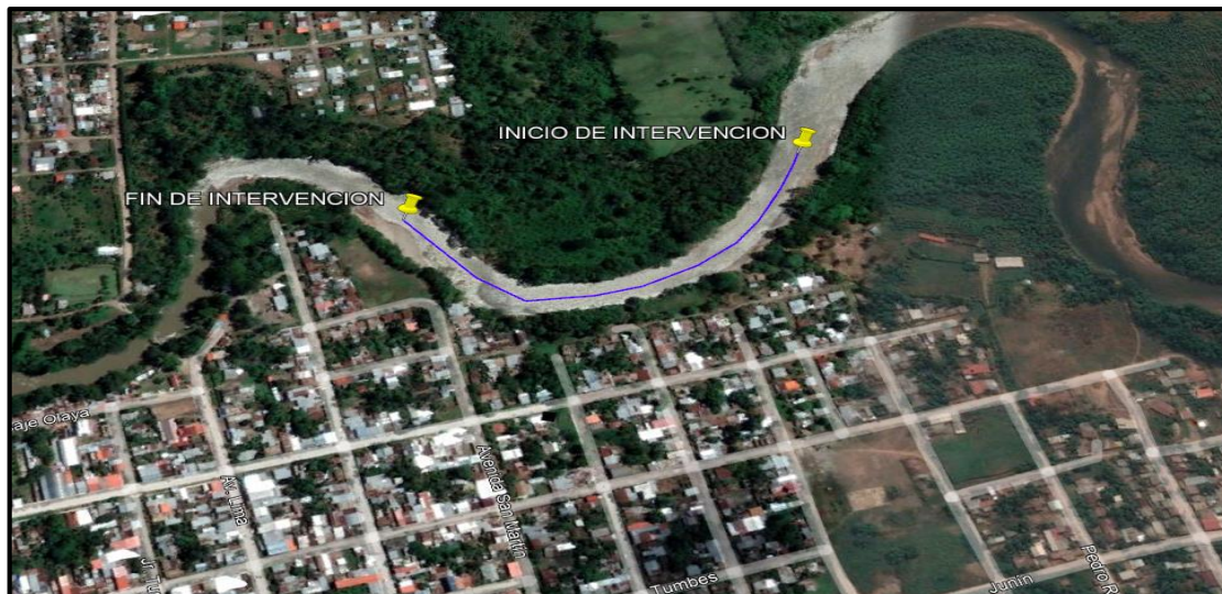
CROQUIS DEL TRAMO A INTERVENIR

El proveedor brindará el servicio desde la fecha de suscripción del contrato hasta setenta y cinco (75) días calendarios después del mismo, o hasta que se consuma el monto del contrato, lo que ocurra primero.