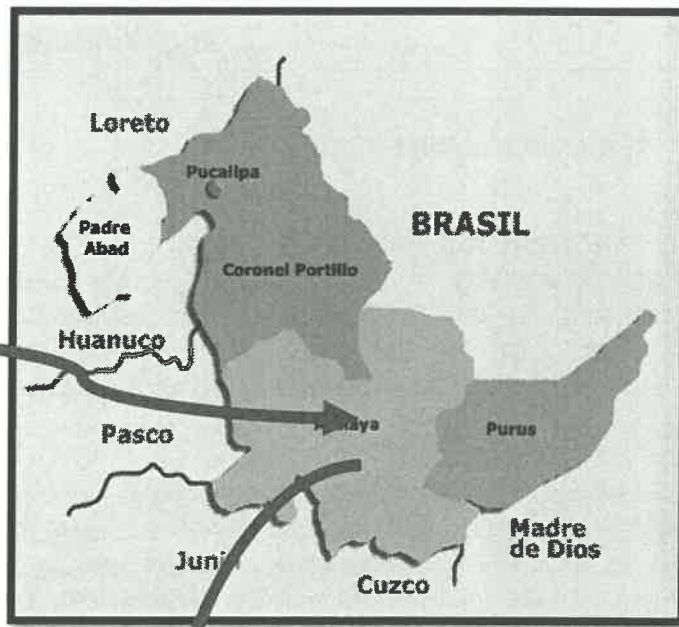
Mapa macro localización del Departamento de Ucayali