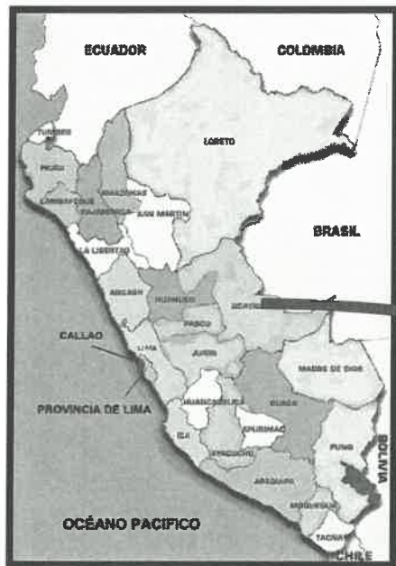
Mapa de macro localización