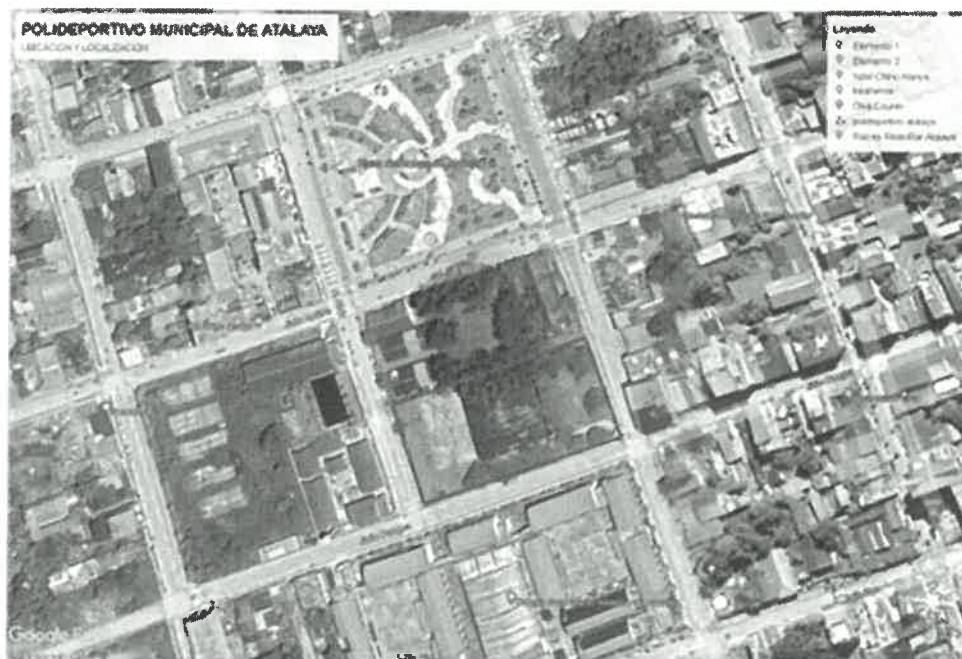
Ubicación del proyecto, vista Satelital