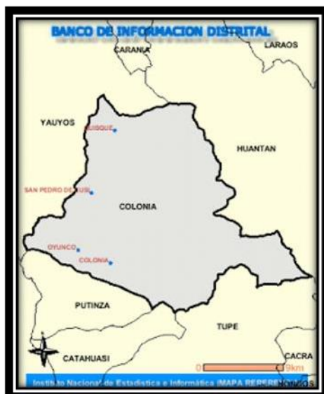
Distrito de Colonia