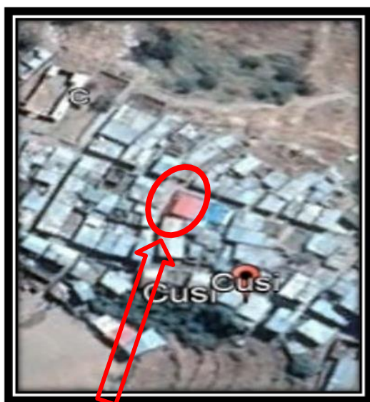
Ubicación Actual de la I.E.I N°422