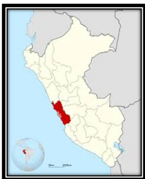
Departamento de Lima

UGEL : 13 Yauyos Localidad : C.P. San Pedro de Cusi Código Modular : 0511162 Código de Local : 362812 Nombre de la I.E. : N° 422