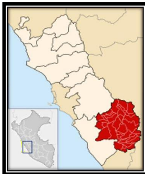
Provincia de Yauyos