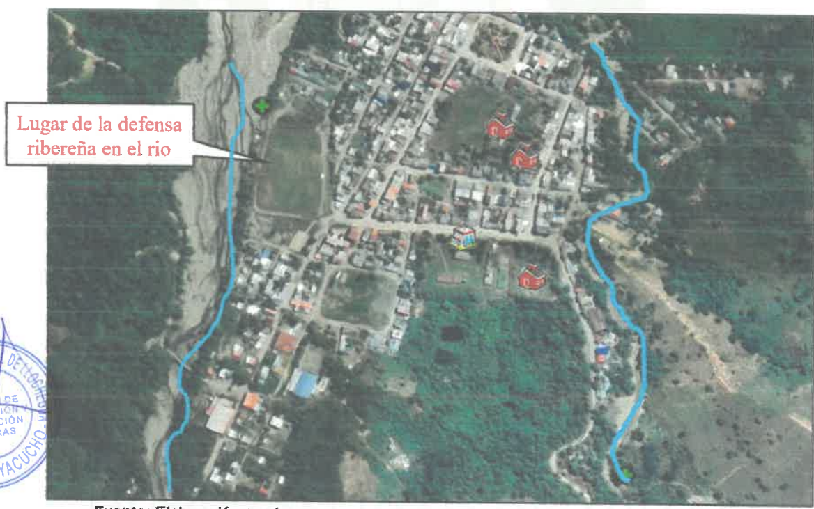
Figura 1. Vista Satelital del Área de Estudio