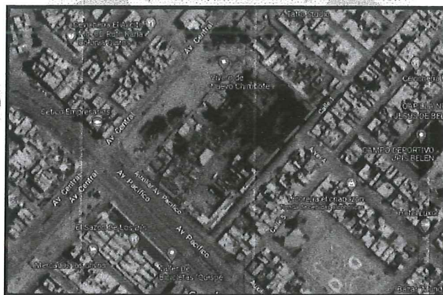
MICRO LOCALIZACION (DISTRITO DE NUEVO CHIMBOTE – TALLER MUNICIPAL)