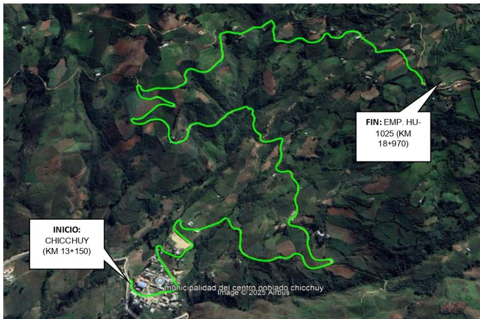
TRAMO 3: CHICCHUY (KM 13+150) - EMP. HU-1025 (KM 18+970). L= 5.820 KM. HU-1024.

"Decenio de la Igualdad de Oportunidades para Mujeres y Hombres" "Año de la unidad, la paz y el desarrollo"