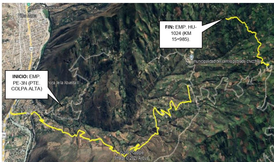
TRAMO 1: EMP. PE-3N (PTE. COLPA ALTA) - COLPA ALTA (KM 0+415); COLPA ALTA (KM 0+587) - ROSAPAMPA - DV. CHICCHUY (KM 8+342); PALTAYNIO (KM 13+790) - EMP. HU-1024 (KM 15+985). L= 10.365 KM. HU-1025.

JR. 28 DE JULIO NRO. 1363 INT. 1367-Huanuco E-mail: ivp_huanuco_2018@outlook.com