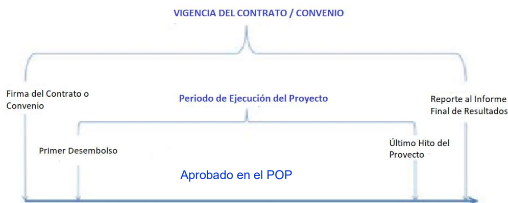
Figura 1. Vigencia del contrato o convenio y del Proyecto