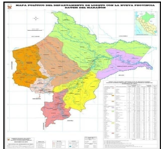
DEPARTAMENTO DE LORETO