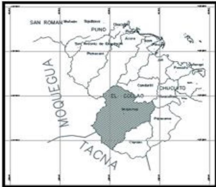
Imagen N°04: Área de influencia del trabajo