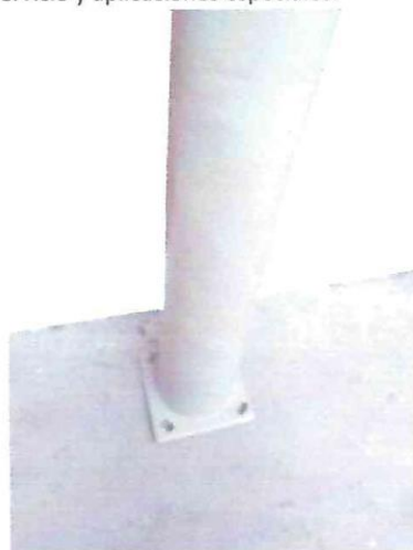
Poste con base o Embone con la instalación sobre la superficie (brida revestida en PRFV para protección a la corrosión y a agentes químicos)