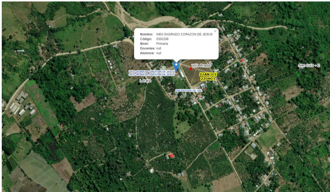
IMAGEN N° 3: ÁREA DE ESTUDIO