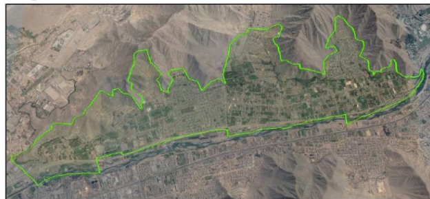
Figura N° 1 : Vista del área de influencia la zona de intervención

El área de influencia, es el ámbito del proyecto "Ampliación de los servicios de agua potable y alcantarillado para nuevas habilitaciones del Esquema Carapongo - Sectores 136 y 137 - Distrito de Lurigancho, Provincia y Departamento de Lima".