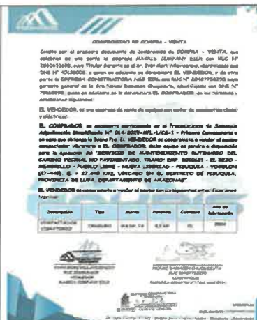
Adjudicación simplificada N°015-2025-MPL-I/CS-1