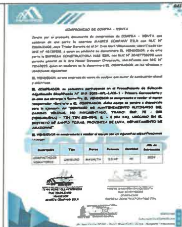
Adjudicación simplificada N°019-2025-MPL-I/CS-1