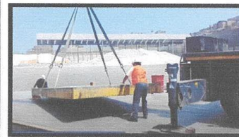
Movilización de plataforma

La calibración de la Balanza se realizará mediante comparación de cargas, la manipulación y medición serán realizados por los especialistas por parte del proveedor.