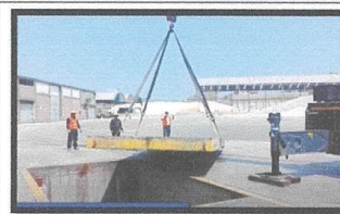
Instalación de plataforma