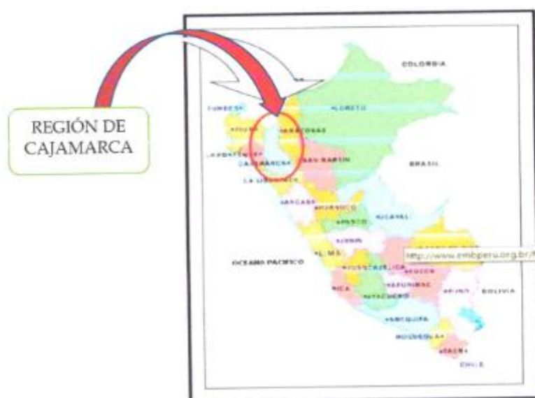
Ilustración 1: DESCRIPCION GRAFICA DE UBICACIÓN GEOGRAFICA.