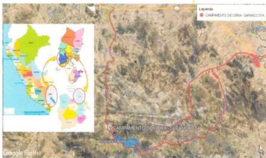
Almacén de obra - Sapanccota

Los bienes materia de la presente convocatoria se entregarán en el plazo de cinco (05) días calendario contados a partir del día siguiente de la firma de contrato y/o notificada la orden de compra, en concordancia con lo establecido en el expediente de contratación.