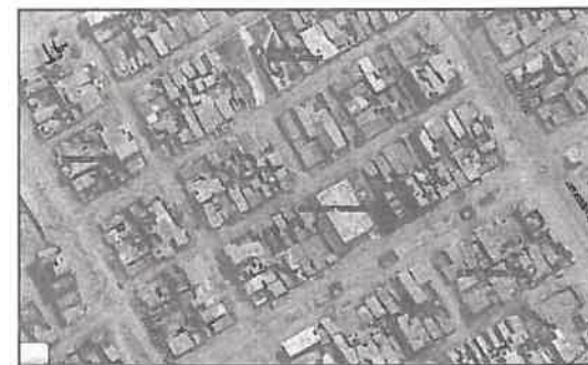
Figura N°1: Ubicación de la I.E. N°157

El perfil del proyecto indica que se construirán las siguientes áreas: