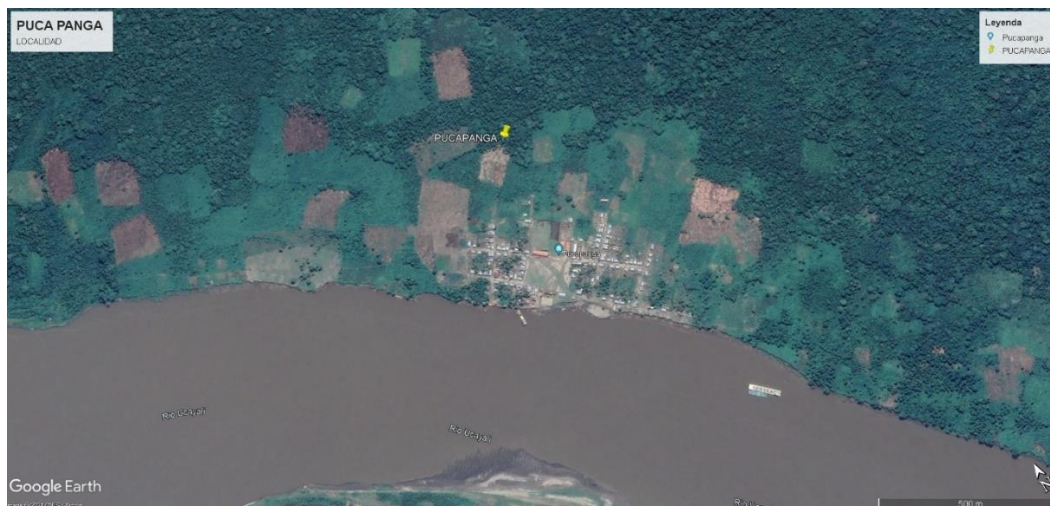
IMAGEN N° 01: VISTA SATELITAL DEL CASERÍO PUCA PANGA