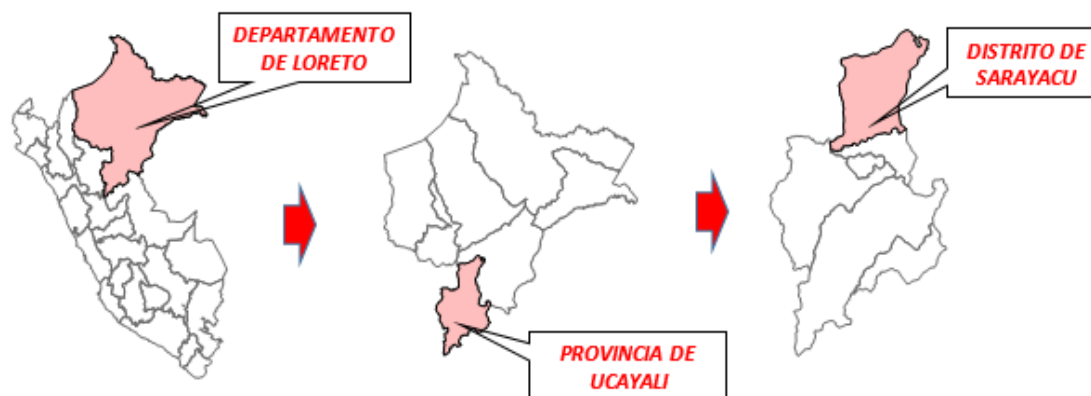
Figura 1: Ubicación política del Distrito de Sarayacu.