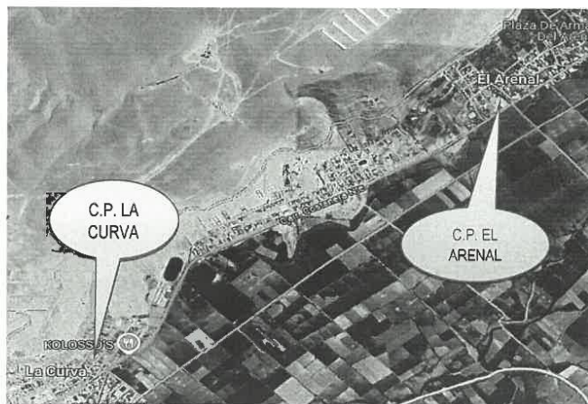
Gráfico 02 Ubicación de la zona donde se desarrollará la SEGUNDA ETAPA del proyecto