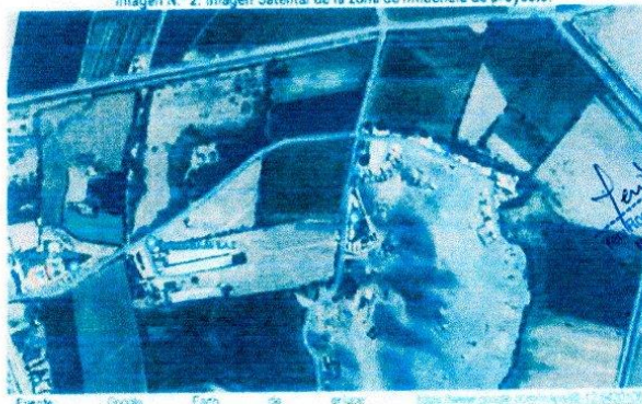
Imagen N° 2: Imagen Satelital de la zona de influencia de proyecto.