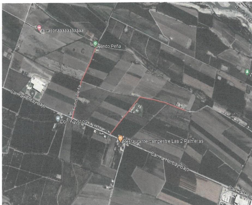
Ubicación del Proyecto