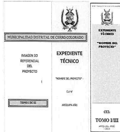
Figura 1. Forma de presentación del Expediente

El contenido máximo de folios por cada archivador será de 200 páginas, salvo cuando el límite obligará a dividir escritos o documentos que constituyan un solo requisito, en cuyo caso se mantendrá su unidad. Por ejemplo, un solo requisito puede ser el Estudio de Mecánica de Suelos, o el Manual de Operación y Mantenimiento. En esos casos, estos documentos no deberán ser divididos en diferentes tomos, deben mantenerse en uno solo. Para el caso específico de los planos se deberá considerar, de preferencia un solo archivador con el contenido integral de los planos generales y de detalles. No siendo limitativo el uso de más archivadores para los planos, según la envergadura del proyecto.