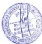
LOCALIDAD DE SAN PEDRO DE CACHI