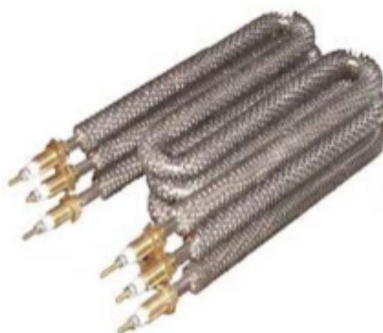
Resistencia Eléctrica (Referencial)

Se refiere al suministro e instalación de la resistencia eléctrica tubular para ducto. Son resistencias tubulares con aleteado continuo, diseñados para rápida transferencia de calor en convección natural y forzada, temperatura máxima de superficie 300 grados centígrados. Se pueden armar en ductos montados en marco metálico o flanges, acoplados a condiciones de aire y gases.