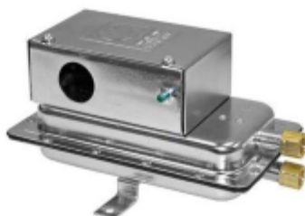
SENSOR DE FLUJO DE AIRE (Referencial)

Se refiere al suministro e instalación del Manómetro Magnagelic (Indicador De Grado De Saturación De Filtro Hepa).