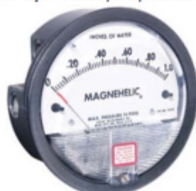
MANOMETRO MAGNAGELIC (Referencial, se califica mejora)

-Se instalara dentro de caja metálica para protección de la intemperie.