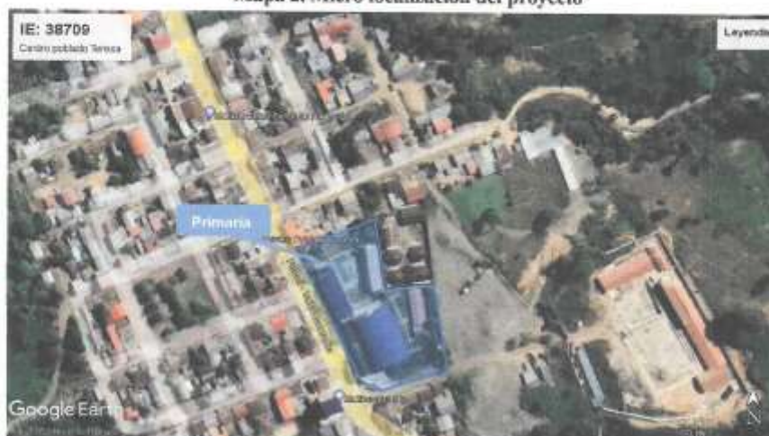
Mapa 2. Micro localización del proyecto