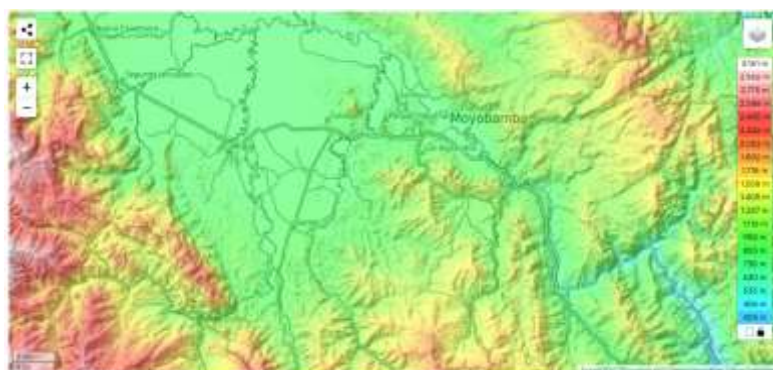
Ilustración N° 07: Mapa Topográfico del Distrito de Jepelecio

El área en un radio de 3 kilómetros de Jepelecio está cubierta de árboles (71 %) y tierra de cultivo (21 %), en un radio de 16 kilómetros de árboles (74 %) y tierra de cultivo (21 %) y en un radio de 80 kilómetros de árboles (86 %).