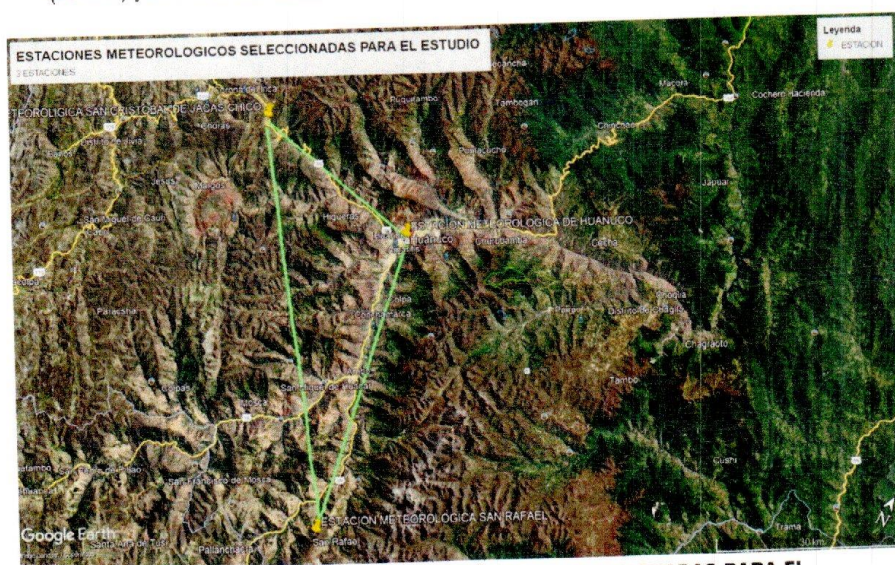
Ilustración 1: ESTACIONES METEOROLÓGICAS SELECCIONADAS PARA EL ESTUDIO - ÁREA DE APOORTE.

El Distrito de Tomay Kichwa, en general, ofrece un clima de condiciones agradables, templado y con lluvias que van de 900 a 1500 mm de precipitación anual. Presenta dos estaciones: una seca, durante los meses de mayo a setiembre (verano) y otra húmeda durante los meses de octubre a abril (invierno).