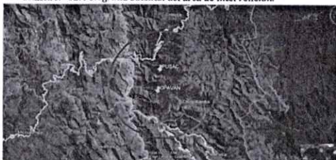
Gráfica N° 02. Fotografía Satelital del área de intervención.