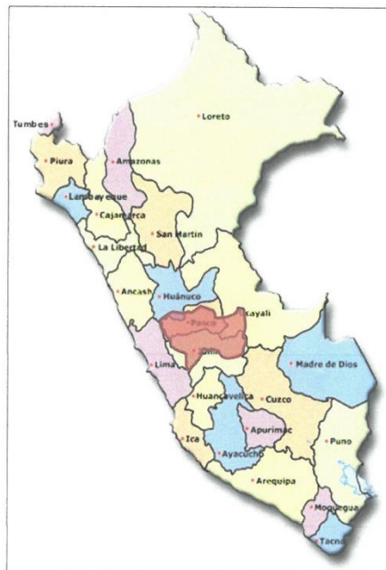
MAPA 01: MACRO LOCALIZACIÓN DEL ESTUDIO