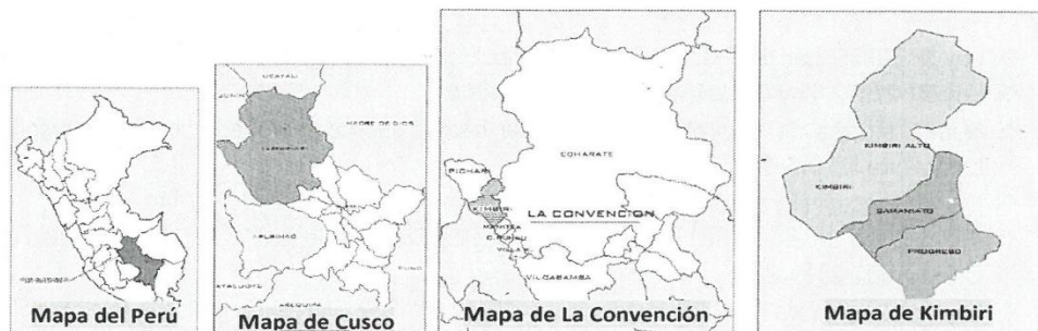
Imagen N° 01: Ubicación localidades beneficiarios en GOOGLE EARTH