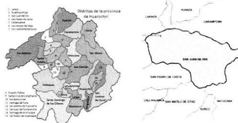
GRÁFICO °02. Micro localización del Proyecto