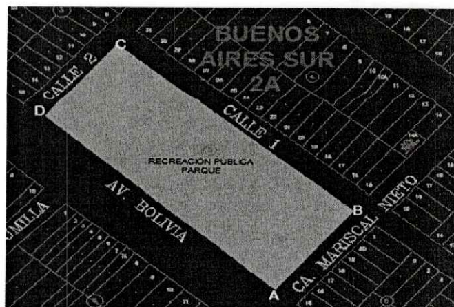
Imagen N°01: Plano de vértices del polígono.