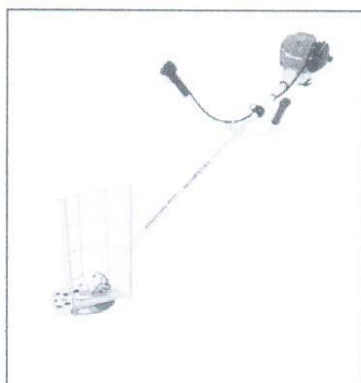
Imagen referencial de motoguadaña: