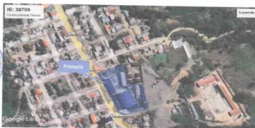
Mapa 2. Micro localización del proyecto