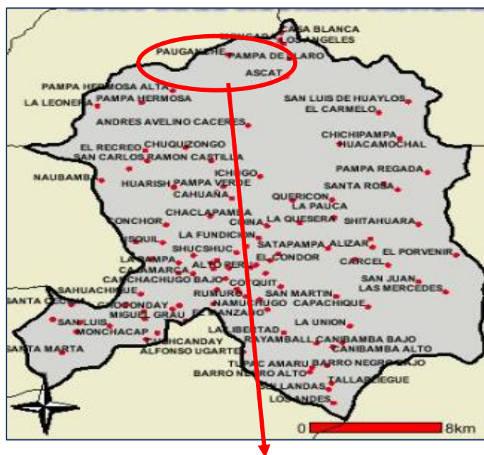
IMAGEN 02: UBICACIÓN DE LOS CASERIOS DE ASCAT Y PAUGANCHE