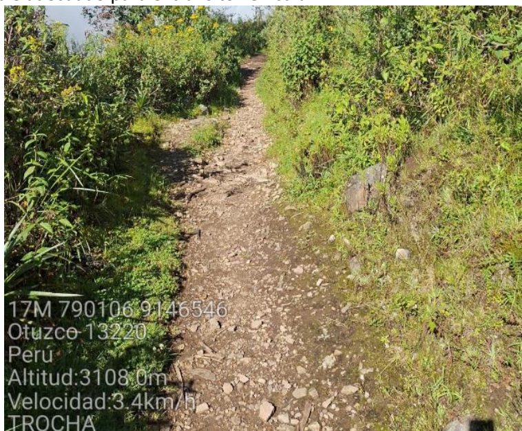
Fotografía N°01- FUENTE PROPIA.

La unión de estos caseríos tanto Ascat y Pauganche no cuentan con una trocha carrozable adecuado para el tránsito vehicular.