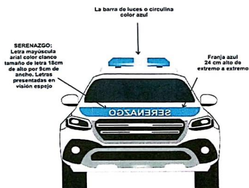
GRÁFICO N° 22 - POSTERIOR