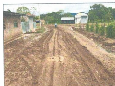
Vista frontal del estado situacional de las vías