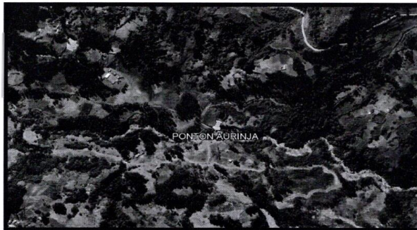
Lugar de ejecución de la Actividad.