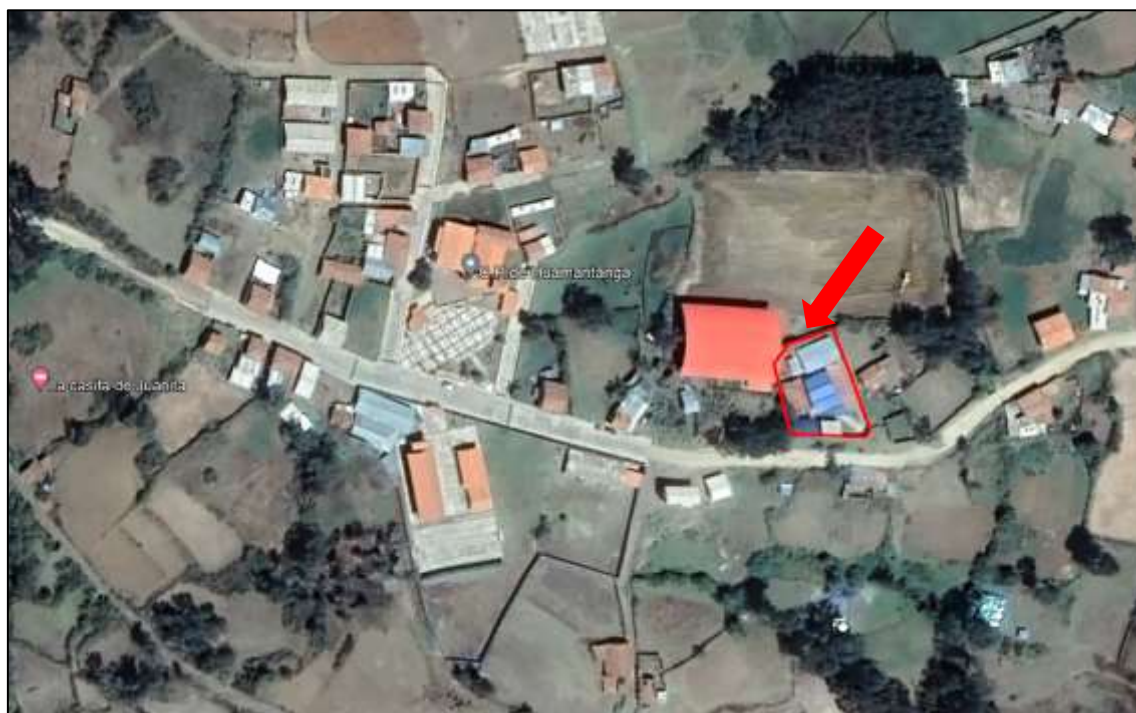
Imagen N° 02: Micro localización del proyecto - Zona de intervención del proyecto.