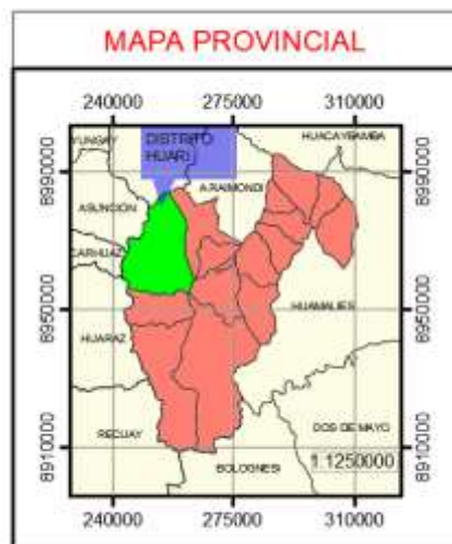
Imagen N° 01: Macro localización del Proyecto – Ancash