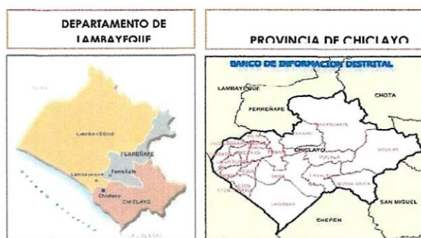
GRÁFICO N° 01: MACROLOCALIZACIÓN