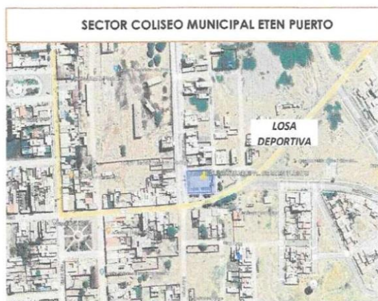
Imagen 2: Ubicación georreferencial de losa deportiva Municipal