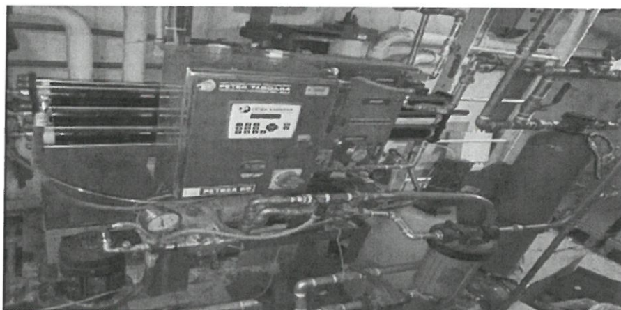
Imagen de la planta de ósmosis inversa.

El personal que realizará el mantenimiento, deberá contar con seguro complementario de trabajo de riesgo (SCTR), además deberá adoptar las normas de seguridad ocupacional con la adecuada indumentaria de trabajo EPP - EQUIPO DE PROTECCIÓN PERSONAL (arnés, casco, guantes, lentes de protección, entre otros).