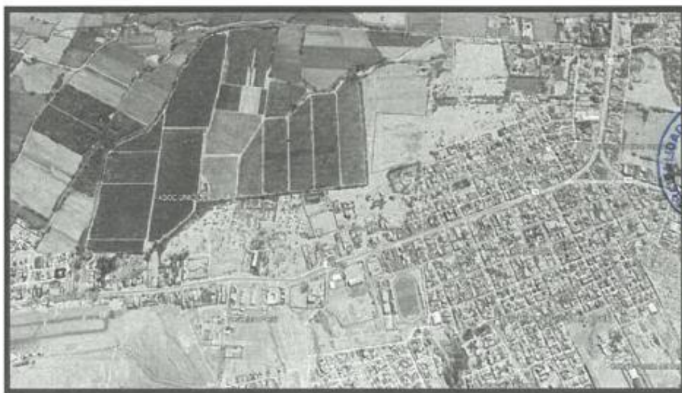
Fig. N° 01: Plano de Marco Localización

La accesibilidad a la zona se realiza mediante transporte interprovincial e Interdistrital que recorren desde la Ciudad de Lima a la zona sur del País y/o viceversa.