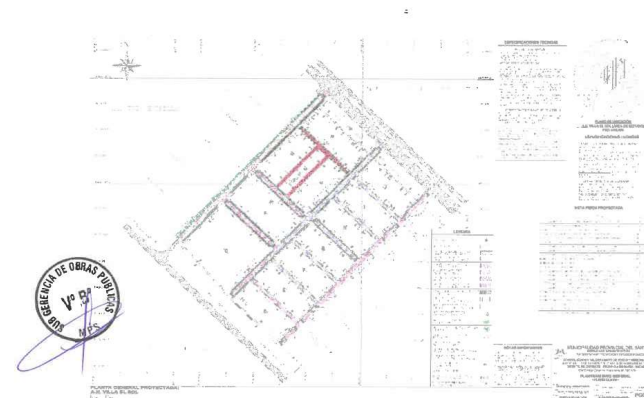
Imagen 01 – Planteamiento Integral del Proyecto

El monto del servicio de la consultoría de obra incluirá el pago de remuneraciones, leyes sociales, gastos administrativos, viáticos, transporte, movilización, personal necesario para cumplir con la consultoría, implementación de del Plan de Vigilancia, Prevención y Control para COVID-19, gastos generales, utilidad y todo gasto necesario para la prestación integral del servicio; así como los gastos generales, la utilidad del SUPERVISOR y los impuestos de Ley, y está de acuerdo a lo indicado en el Expediente Técnico y el Valor Estimado que determina el área de Contrataciones de la Entidad.