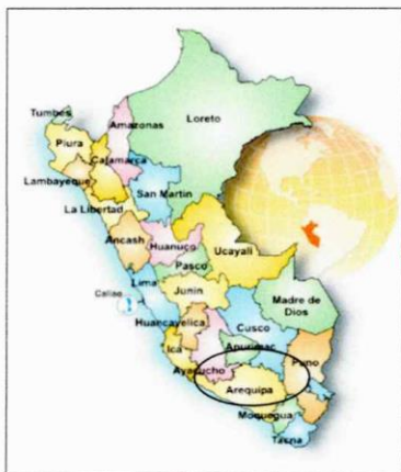
Ubicación del Proyecto

En los mapas siguientes se detalla la macro y micro localización donde se ejecutará el proyecto objeto del presente estudio.