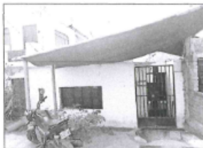
Imagen 01. Vista del área correspondiente a inmueble afectado ubicado en Psje. La Virgen N° 107.