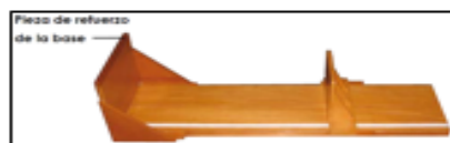
Imagen referencial N°01: Infantómetro para niñas y niños menores de dos años.