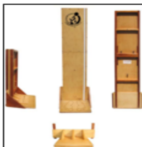
Imagen referencial N°02: Tallímetro móvil para niñas y niños menores de cinco años.