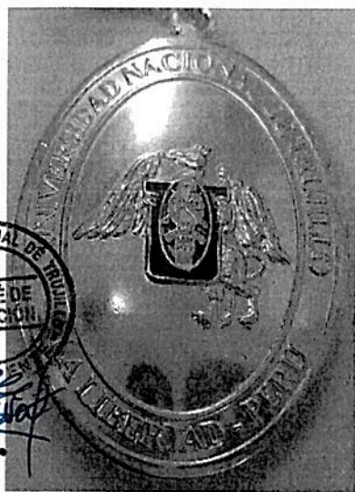
FIGURA 01 anverso