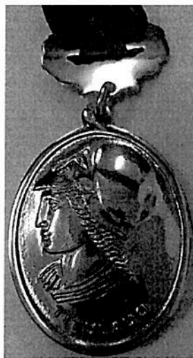
FIGURA 01 reverso