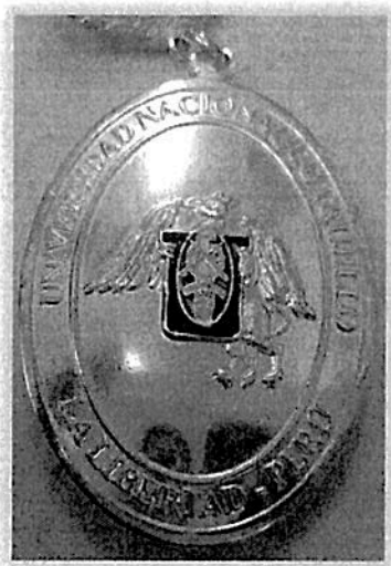
FIGURA 01 anverso