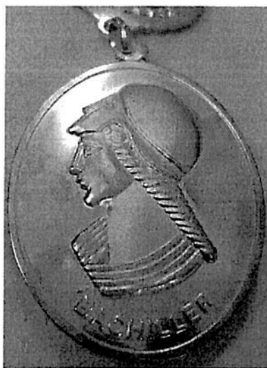
FIGURA 01 reverso