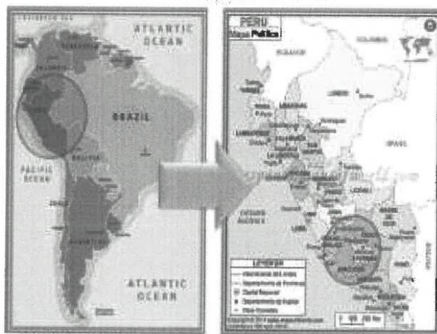
FIGURA N° 01 - MAPA DE UBICACIÓN MACRO